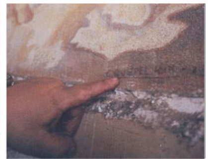
En el ángulo inferior derecho se observa la firma del pintor.

"El Fauno" y "Hércules en el Jardín de las Hespérides", los cuales se habrían perdido por la realización de las obras de remodelación y ampliación de los ambientes del Palacio Legislativo. En cuanto a "El Juicio de Paris", será restaurada mediante un convenio que se firmará con la Escuela Nacional de Bellas Artes.