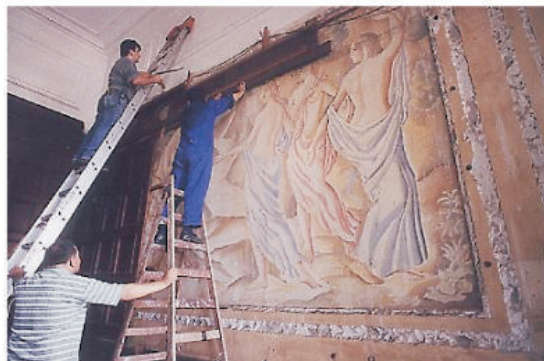
Trabajadores del Congreso en plena labor de develar la hermosa obra.

La obra había estado cubierta por un enchape de madera durante varios años debido a trabajos de remodelación en el recinto parlamentario en el año 1951. Un alto zócalo de madera, de impecable estilo inglés, circundó el gran salón comedor, en la parte izquierda alta quedando así prisionero Paris, el segundo hijo de Priamo y de Hécuba con la famosa manzana de la discordia, entre el zócalo cuyas amarrias no habrán dejado de lastimar el motivo.