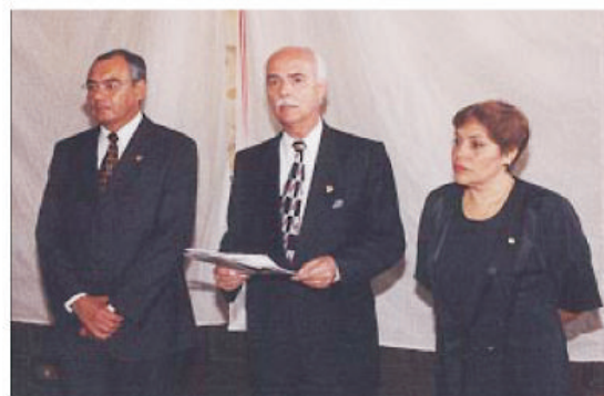
El Presidente del Congreso pronunció un discurso.

viajó a Europa becado por el gobierno español y continuó su formación en la Real Academia de San Fernando, de Madrid, en 1926. Junto a pintores como